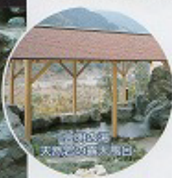
檜づくりの湯 天然浴の露天風呂