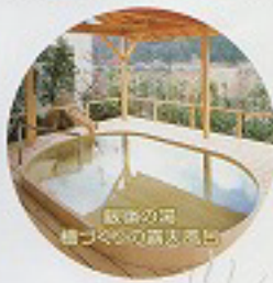
飯沼の湯 檜づくりの露天風呂