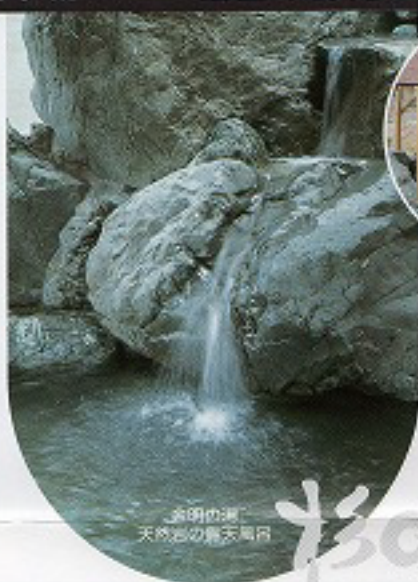
天明の滝 天然浴の露天風呂