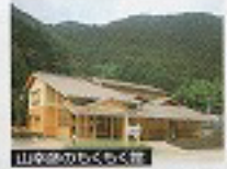
山吹のちくもく館

吉野村の歴史、11ヶ村、村の中核は吉野村の特産と林業の歴史と生活の経緯等を時空と表示で紹介する資料館であった「山神谷のちくもく館」又、自然木工造りのお宿もある。木造校舎を改造して造った「トントン工房」があり、木工造りにしてしんだ薪ストーブハウスでカントリーチェックが楽しめるのも一楽也。