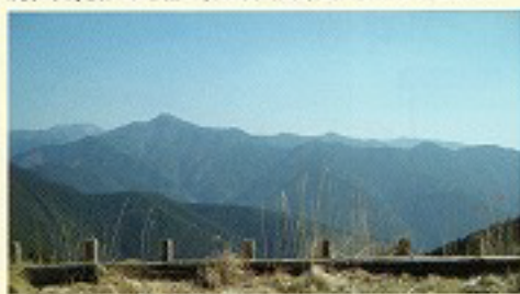
馬の背展望台からの眺望