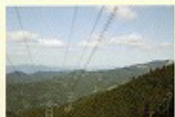
扇形山から柏原山を望む

ていき、スタートから30分ほどで右手に高さ10mほどの滝があります。その後丸木橋を何度も渡ると、雑木が茂る広場に出ます。そこから尾根伝いに急な坂道を登ると鉄塔下に出ます。ここから扇形山や小南峰の稜線、柏原山、四寸岩山などを見渡すことができます。扇形山山頂へはここから約30分。山頂から東へ金剛嶺城山、二上山などの山並みを見ながらアッ