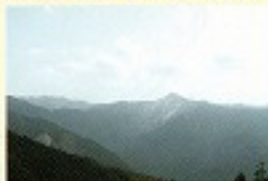
柏原山山頂付近鉄塔下からの眺望

上中戸バス停から飲料水供給施設前をとおり柏原山へ向かいます。山頂付近は雑木林に囲まれています。少し進んだ先にある鉄塔下からは、四寸岩山や尖った大天井ヶ岳の山容を眺めることができます。尾根伝いにしばらく歩くと