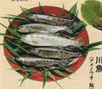
川魚 (サマシウオ鮎)