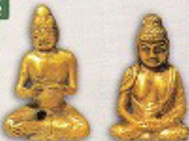
黄金仏(全釈尊像坐像)